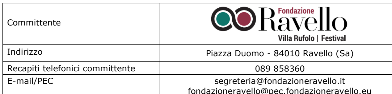
FIGURE DI RIFERIMENTO

Al fine di stabilire la linea di comando e le persone di riferimento dell'appalto vengono di seguito riportati i nominativi dei responsabili del committente